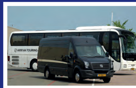
19-persoons VIP bus